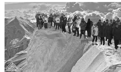
Seniorenwandergruppe am Mount Everest