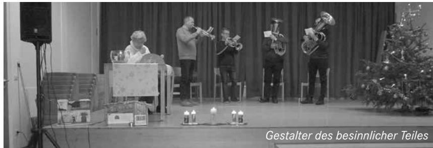
Gestalter des besinnlicher Teiles