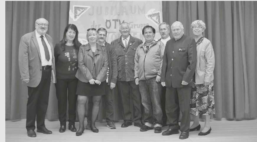
Bei der Generalversammlung unserer Gruppe am Samstag, 16. Oktober 2021, ab 15.00 Uhr, wurde folgender Vorstand gewählt: