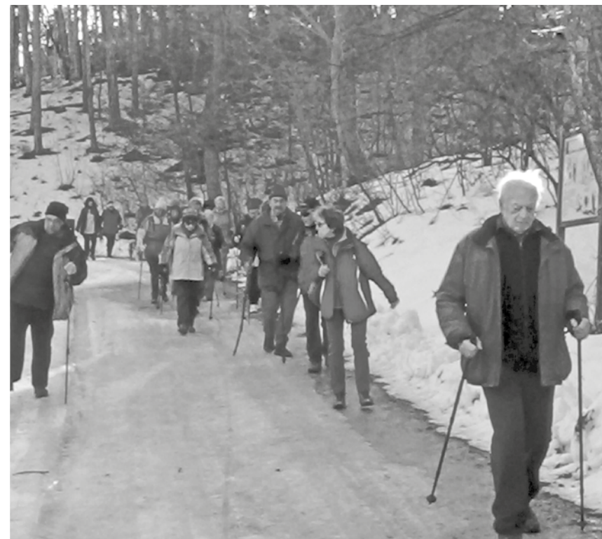
Rüstige Senioren unterwegs im Wienerwald

REDAKTIONSSCHLUSS 1. Februar 2020 Beiträge senden Sie bitte an ge.steindl@aon.at