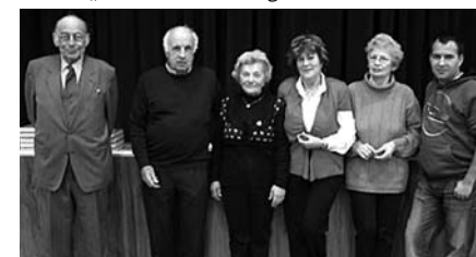
Vereinsabzeichen in Silber/Gold/Bronze