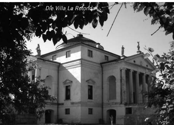
Die Villa La Rotonda

berühmtem Gemälde von Paolo Veronese. In der Altstadt besichtigten wir das Teatro Olimpico, das erste überdachte Theater der Neuzeit und den Palazzo Chiericato (auch von Palladio) und die Chiesa di S. Corona. Bei der Basilika Palladiana an der Piazza dei Signori erfuhren wir, dass eine Basilika nicht immer eine Kirche ist.