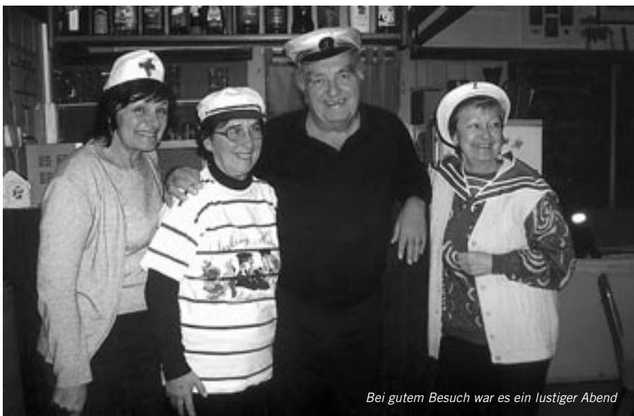
Bei gutem Besuch war es ein lustiger Abend